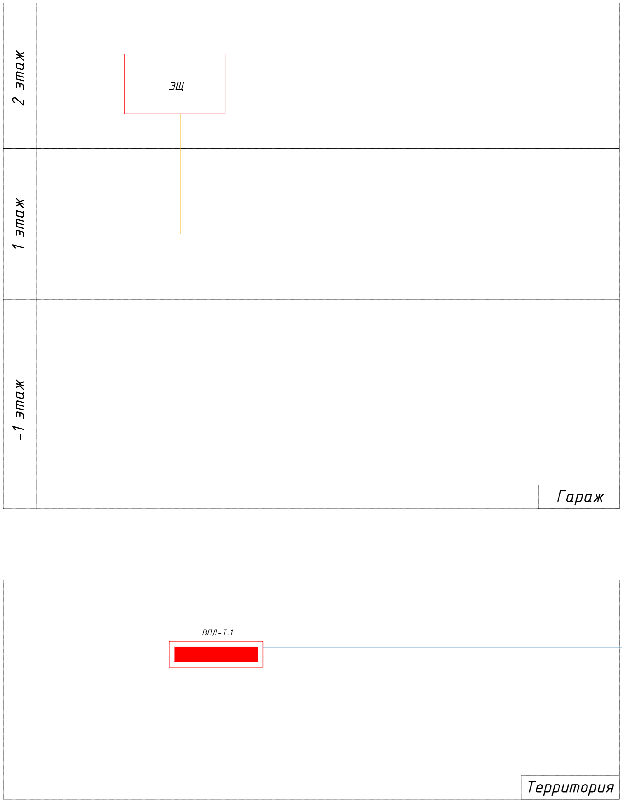
УСЛОВНЫЕ ОБОЗНАЧЕНИЯ И ИЗОБРАЖЕНИЯ

Инв. № подл. Подпись и дата. Взам. инв. №